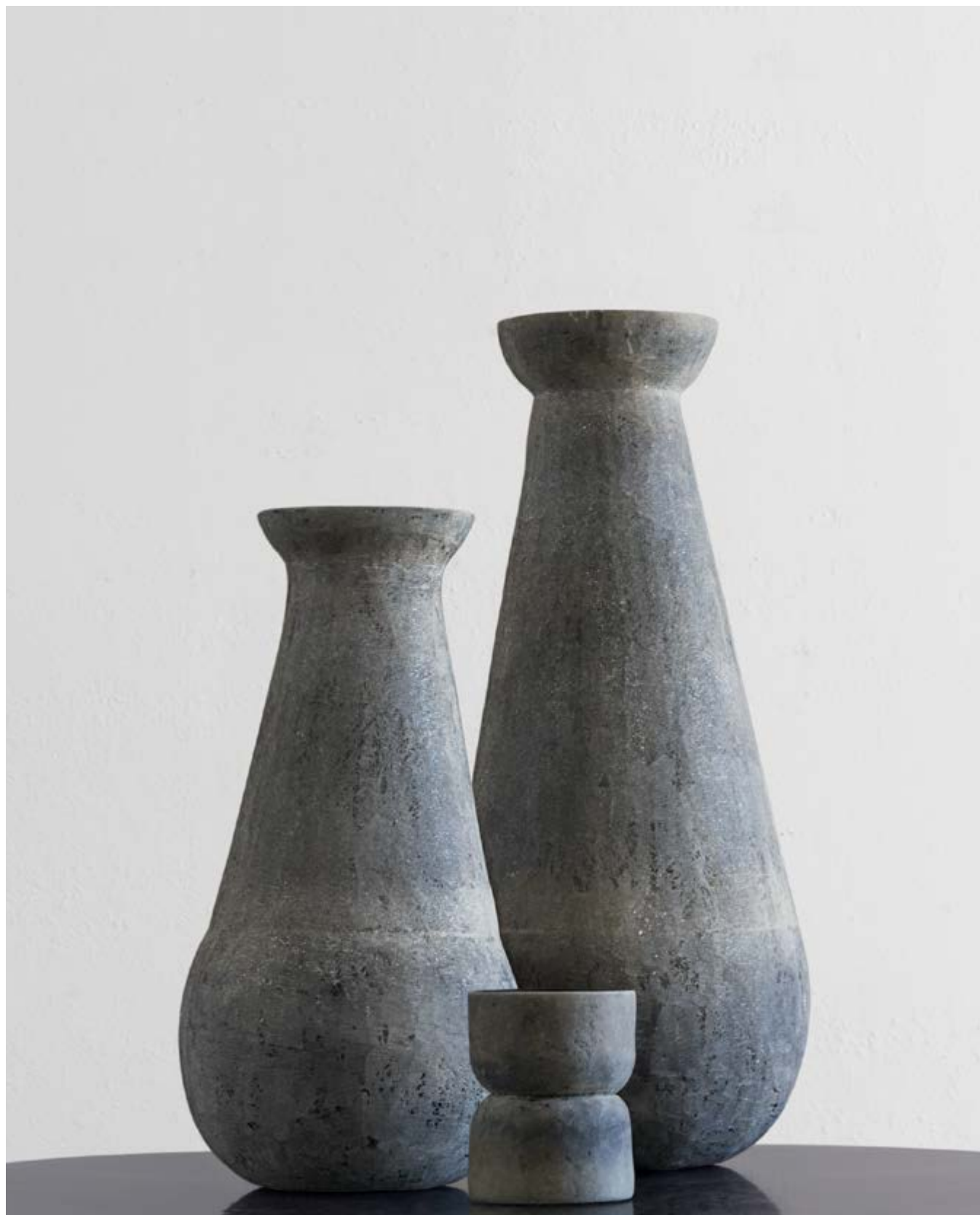
tribù design verter turrone 2020