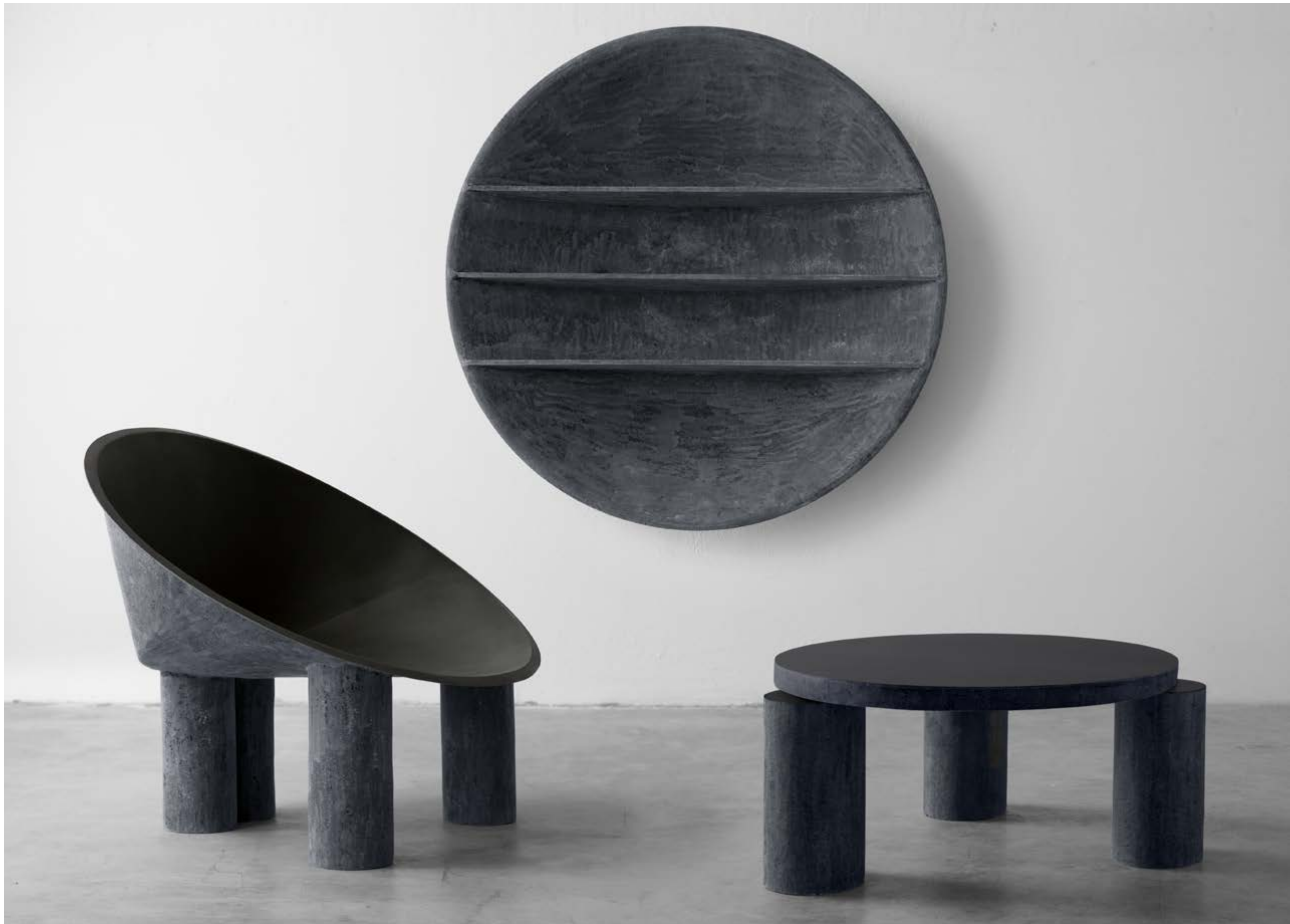
aspis design verter turrone 2020

libreria in vetroresina bookshelf in fibreglass